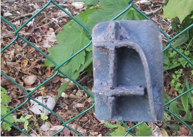
Photographie de la marque

Règlement publié le 1 er août 2017 et entrant en vigueur au 1 er janvier 2018